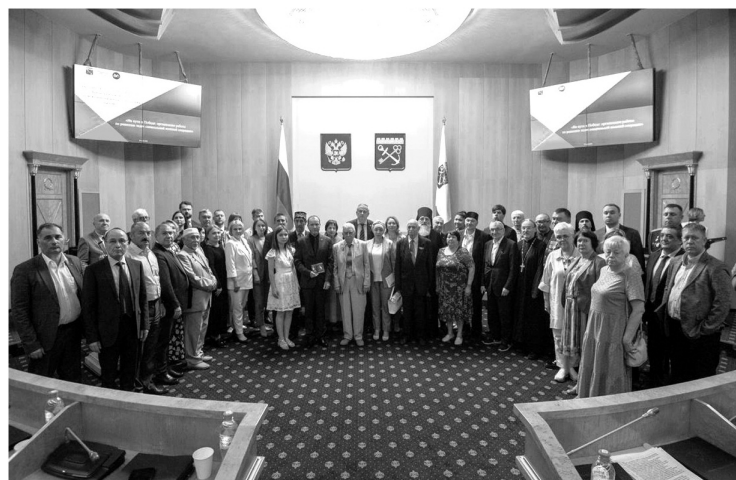
Участники Совета при губернаторе Ленинградской области по межнациональным отношениям

ЛЕНИНГРАДЦЫ РАЗНЫХ НАЦИОНАЛЬНОСТЕЙ И РЕЛИГИЙ ОБЪЕДИНИЛИСЬ, ЧТОБЫ ПОДДЕРЖАТЬ РЕШЕНИЯ ПРЕЗИДЕНТА