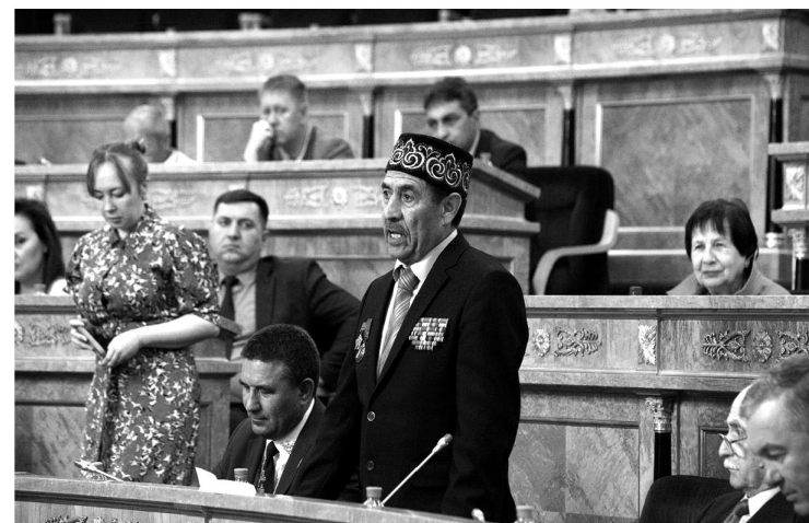
На заседании выступили представители национальных общин и религиозных организаций региона